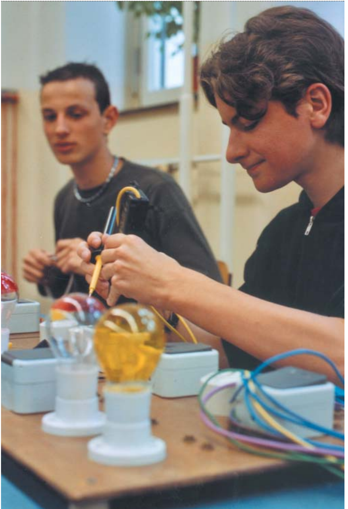
Titel: Rechte und Pflichten